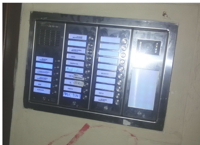
foto: stávající tablo při vstupu do byt. domu

VEŠKERÉ POHLEDOVĚ EXPONOVANÉ PRVKY A JEJICH SPECIFIKACE (BAREVNOST, LESK APOD.) BUDOU PODLÉHAT ODSOULASOVACÍMU PROCESU VZORKOVÁNÍ A BUDOU POUŽITÝ PO ODSOULASENÍ INVESTOREM A ARCHITEKTEM (AUTOREM PROJEKTU)